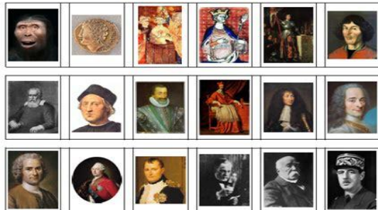
Le personnage mystère

Ecole Jeanne d'Arc - 3 esplanade du Capitole - 17100 SAINTES